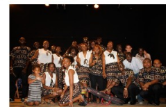
Chorale Jeune Espérance (Toulouse)