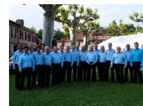
Passion Lyrique (Pinsaguel)