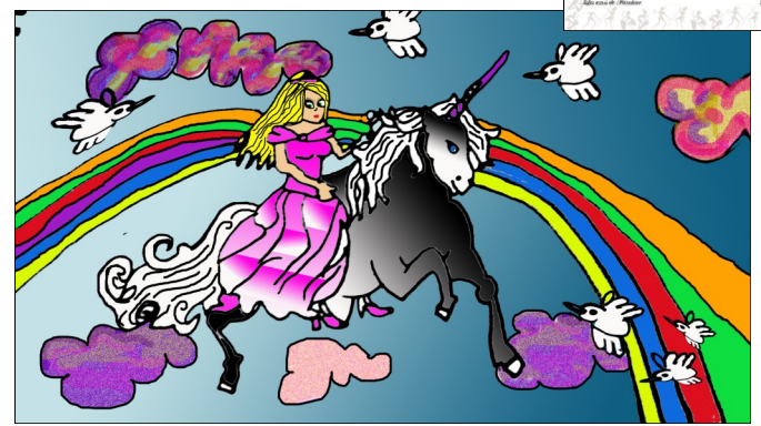
Illustration du conte La corne magique par Elsa, Eric et Mar Garcia FUSTÉ, de Rosas.

« Les Cops du Campus Vidal comptent bien conserver ce titre dans l'avenir ! Merci aux Amis de Fambine » Sandy