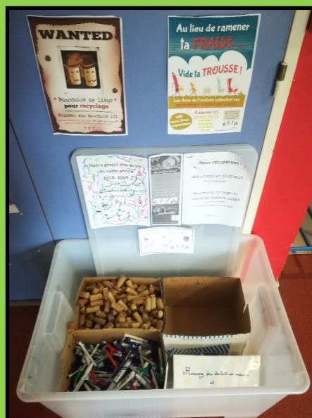
(École Marcel Langer, à St Jean)